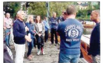
Genomgång av båtparaden hos Västermalms BK.