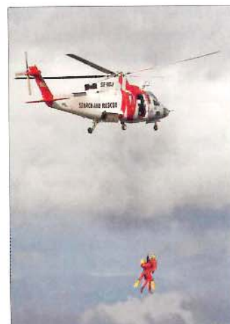
Nytt för i år var sjöräddningsuppvisningen.