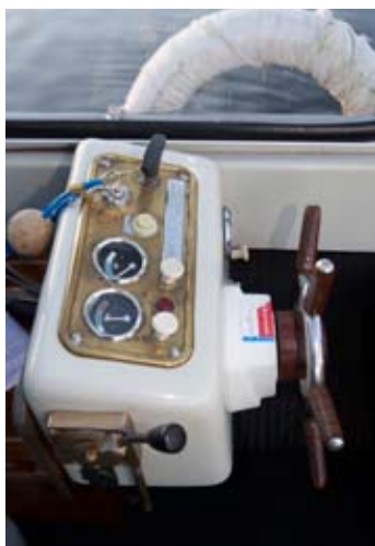
En rejäl konsol i stället för raten i längsled som på konkurrenten Myra 20. Tar mer plats men känns mer gediget.